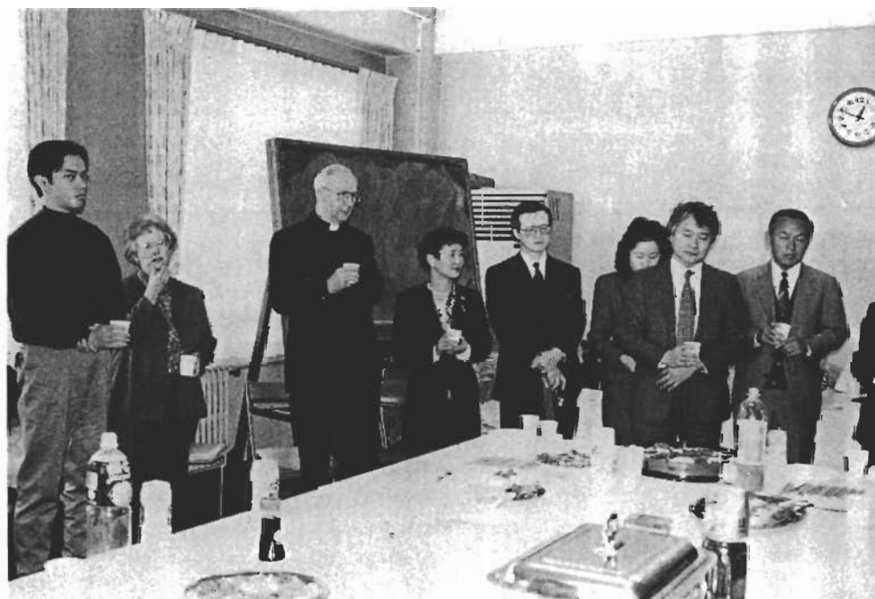
▲最終講義のあとのパーティー