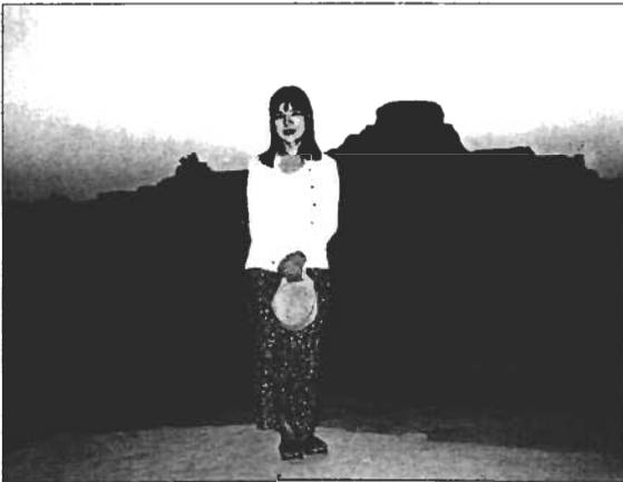
「モヘンジョダロ遺跡の撮影の合間にパチリ。ここで見た夜明けは素晴らしい。」